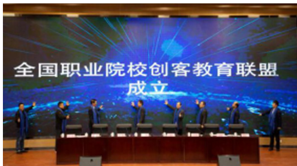
全国职业院校创客教育联盟成立仪式

发挥政府、企业、学校、校友联动作用，与日照市共建创客教育大本营，联合新道科技股份有限公司共建全国首个校企合作的创客教育学院，联合国内38所高职院校牵头成立全国首个创客教育联