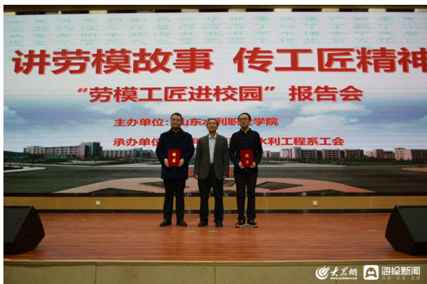
“劳模工匠进校园”报告会

一是在思想政治理论课程教学过程中突出强调劳动教育。《思想道德与法治》《职业规划与就业指导》等课程中注重讲清我国社会主义劳动制度、劳动法律法规，让学生建立通过诚实劳动、合法劳动获取劳动价值的观念。二是在课程思政中挖掘劳动教育的元素。学校注重将思想价值引领贯穿教育教学全过程，成立了课程思政教学研究中心，引导教师教学要育人为先，善于发掘专业课程中所蕴含的马克思主义辩证唯物主义、历史唯物主义等劳动哲学思想，使学校开设的课程门门有思政，所有教师都能做到人人讲育人，实现所有课程都能承担劳动育人的功能。