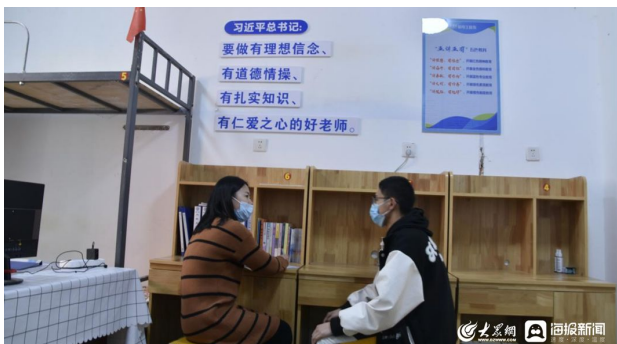
辅导员工作室进公寓