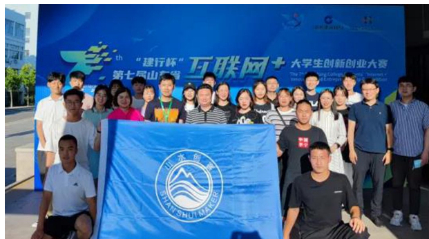
学校参加第七届“互联网+”创新创业大赛

大赛成果丰硕。学校每年有 10000 余名学子在各类创新创业大赛和实践中大展风采。2017 年以来，荣获全国职业院校技能大赛创新创业赛项、中国国际“互联网+”大学生创新创业大赛等国家级奖项 32 项，省部级奖项 458 项。